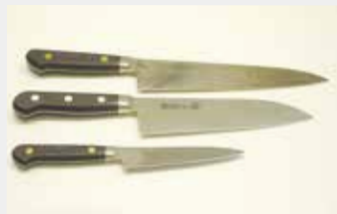
14 牛刀・三徳包丁・ペティーナイフ

牛刀 ■サイズ:21cm ■数量:1 三徳包丁 ■サイズ:18cm ■数量:1 ペティーナイフ ■サイズ:12cm ■数量:1