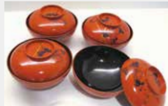
35 汁椀(柄入り蓋つき)