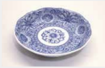
49 取皿 (輪花綿描牡丹) ■数量:25