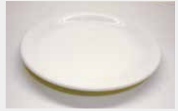
52 平皿 (ベージュ) ■サイズ:23cm ■数量:6