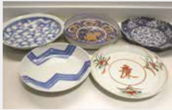
57 大皿各種 ■数量:全5