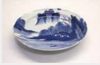
54 平皿 (山水柄) ■サイズ:22cm ■数量:10