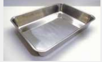
8 ステンレス角バット