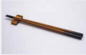
58 箸・箸置き ■数量:各25