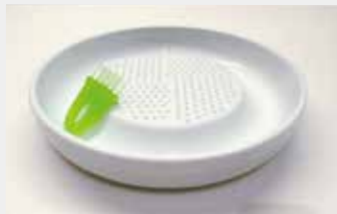
13 セラミックおろし器