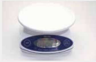
26 デジタルクッキングスケール