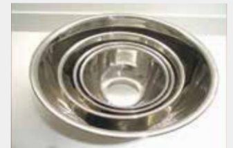
10 ステンレスボウル