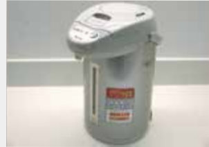
30 電気沸騰エアーポット