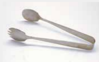
19 サラダサービストング