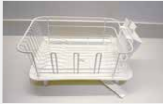
61 水切かごA ■数量:1