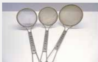
22 ステンレス丸カス揚