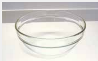
46 スタックガラスボウル