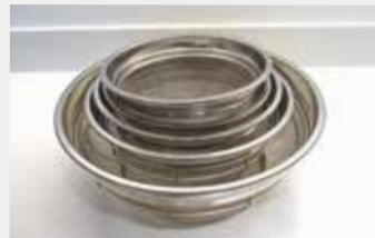
11 ステンレス浅型ざる

■サイズ:20cm ■数量:2 ■サイズ:22.5cm・25cm・33cm ■数量:各1