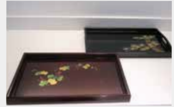
60 お盆 (漆塗り) ■サイズ:50cm×30cm ■数量:2