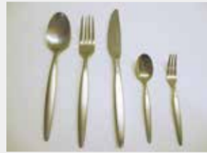
59 スプーン・フォーク・ナイフ・ コーヒースプーン・ヒメフォーク ■数量:各25