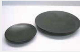
51 平皿 (深緑) ■サイズ:12cm・20cm ■数量:各25