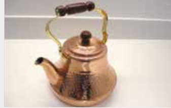
31 純銅クラッシーケトル