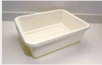
62 水切かごB ■数量:2