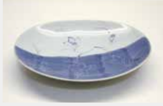
53 平皿 (楕円形) ■サイズ:18cm ■数量:8