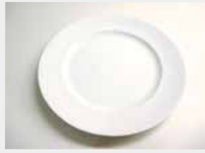
50 平皿 (白) ■サイズ:25.5cm ■数量:25