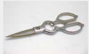
16 キッチンバサミ リムーブ