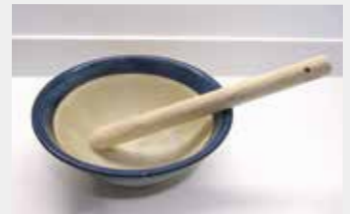
12 スリ鉢(シリコンゴム付)・木製すりこぎ棒

■サイズ:20cm ■数量:2 ■サイズ:22.5cm・25cm・33cm ■数量:各1