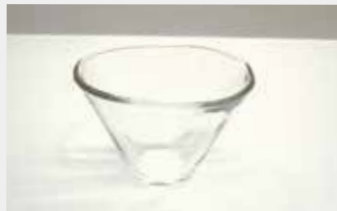
42 ガラス手びねり小付