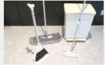
64 掃除道具一式 ゴミ箱 ■サイズ:45型(4分別も可能)