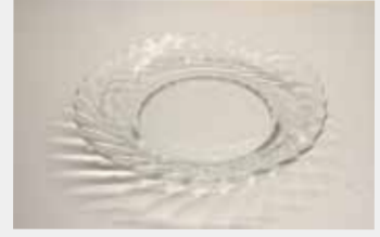
56 ガラス皿 ■サイズ:21cm ■数量:7