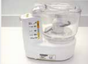
29 フードプロセッサー