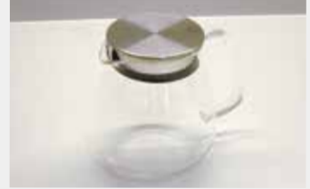
32 ワンタッチティーポット