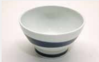
33 有田焼新刷毛茶碗