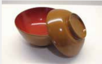
37 汁椀(やや深 蓋つき 黄)