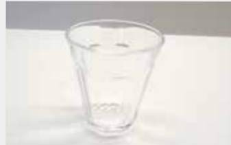
39 ガラスタンブラー