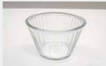
43 Puddingキャラメルカップ