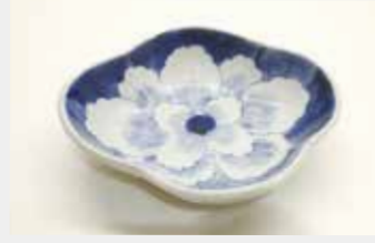
55 変形皿 (花柄) ■サイズ:15cm ■数量:10